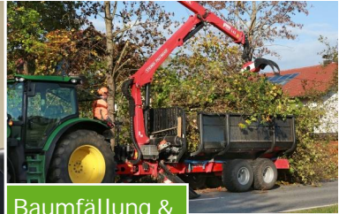
Baumfällung & Gehölzpflege